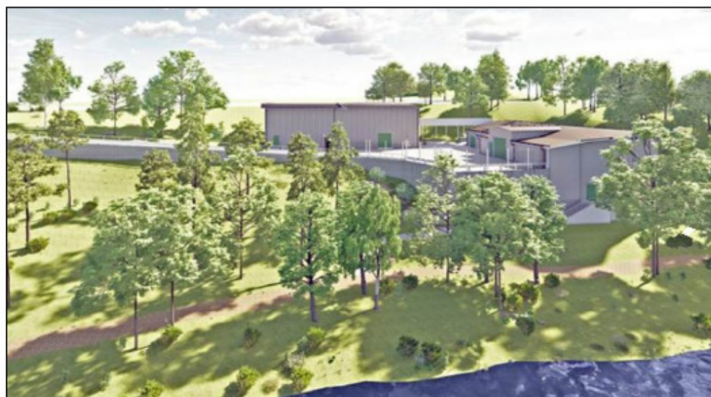
Illustration från sjösidan (Vadviken). Det nya reningsverket ses i mitten av bilden,

Många fler boende kommer då att kunna ansluta sig till kommunalt vatten och avlopp året runt. Dessutom tillkommer nya smarta, säkra och mer miljövänliga lösningar med utbyggnaden av reningsverket.