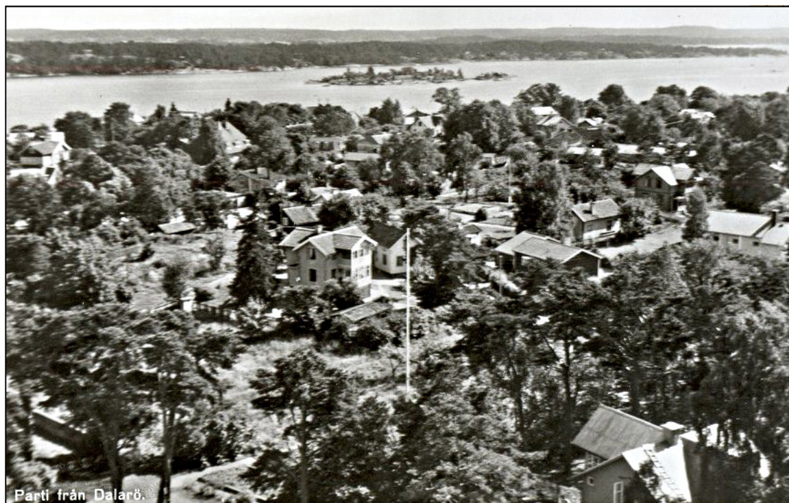
Parti från Dalarö.

I bakgrunden syns Jutholmen och bakom denna Aspö.