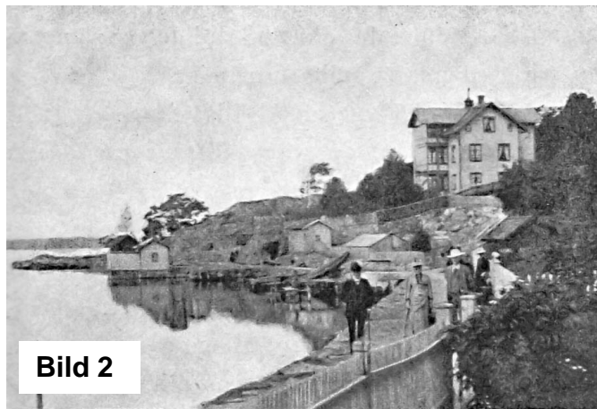
Tidigare Strandvägen nu Dalarö Strandväg. Vy mot Dalarö Udd. Huset på bilden är byggt 1870.